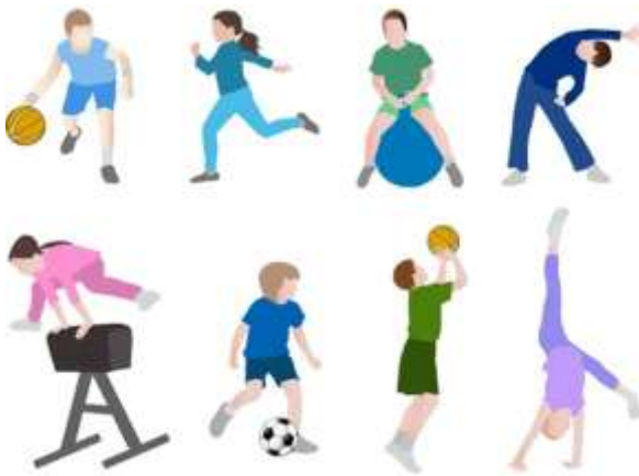
Habilidades Motrices Básicas (HMB)

Desde el área de Educación Física se distinguen las capacidades físicas básicas de los niños/as (resistencia, fuerza, velocidad y flexibilidad) importantes a la hora de tenerlas en cuenta para cualquier tipo de actividad a realizar. En base a ellas, aparecen las habilidades motrices básicas.