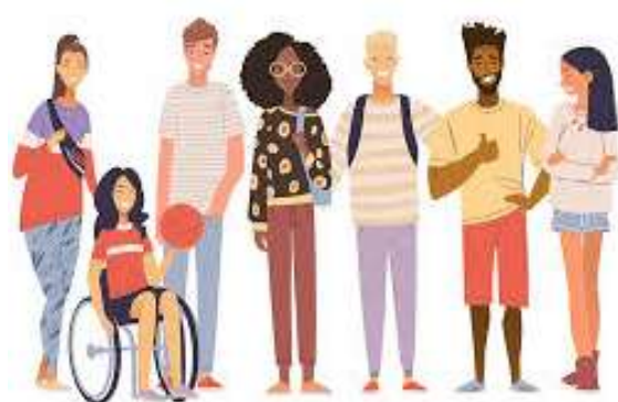
Educación inclusiva y atención a la diversidad

La diversidad hace referencia a las diferencias que pueden existir entre personas por su cultura, grupo social, género, religión, formas de pensar, limitaciones... Por ello, debemos estar preparados para encontrar soluciones en busca de una educación inclusiva de calidad que haga avanzar la comunidad.